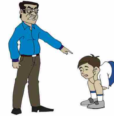
Child in Murga position outside classroom