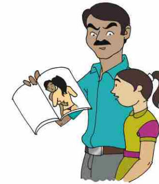
An adult male showing indecent photographs to a child