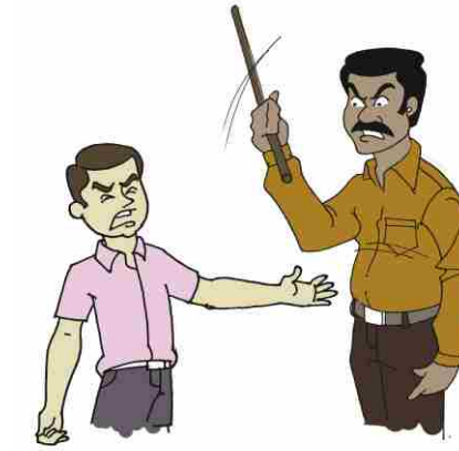
Hitting with cane

ਸ਼ਰੀਰਕ ਬਦਸਲੂਕੀ ਦਾ ਨਤੀਜਾ ਛੋਟੀ ਚੋਟਾਂ ਤੋਂ ਲਈ ਕੇ ਕਈ ਗੰਭੀਰ ਜਖਮਾਂ ਤੱਕ ਹੋ ਸਕਦਾ ਹੈ। ਇਸ ਦੇ ਲੰਬੀ ਮਿਆਦ ਦੇ ਭਾਵਨਾਤਮਕ ਪ੍ਰਭਾਵ ਵੀ ਹੋ ਸਕਦੇ ਹਨ।