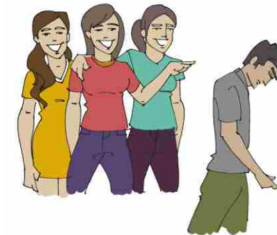
Eve teasing of a boy by a group of girls