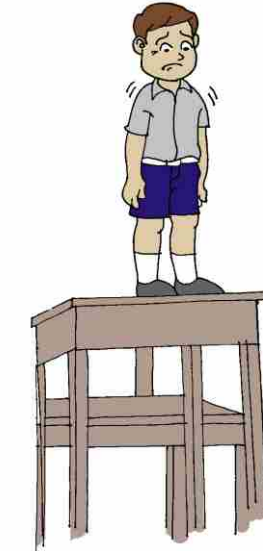
Make a Child stand on desk in a classroom