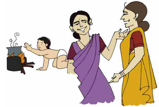
Mother neglecting her child and busy talking to the neighbour

ਅਣਗਹਿਲੀ ਮਾਪਿਆਂ ਜਾਂ ਸਰਪ੍ਰਸਤ ਦੁਆਰਾ ਇੱਕ ਬੱਚੇ ਦੀਆਂ ਮੁੱਢਲੀਆਂ ਲੋੜਾਂ ਜਿਵੇਂ ਭੋਜਨ, ਆਵਾਸ, ਕੱਪੜੇ, ਸਿੱਖਿਆ, ਮੈਡੀਕਲ ਸਹਾਇਤਾ, ਪਿਆਰ ਅਤੇ ਭਾਵਨਾਤਮਕ ਸਹਿਯੋਗ ਆਦਿ ਨੂੰ ਮੁਹੱਈਆ ਕਰਨ ਵਿੱਚ ਅਸਫਲਤਾ ਨੂੰ ਕਹਿੰਦੇ ਹਨ।