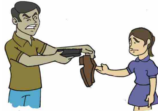
Older child bullying the younger child to polish his shoes

ਧੱਕੇਸ਼ਾਹੀ ਲੋਕਾਂ ਦੇ ਇਕ ਦੂਜੇ ਨਾਲ ਗੱਲਬਾਤ ਕਰਨ ਦੇ ਕਿਸੇ ਵੀ ਪ੍ਰਸੰਗ ਵਿਚ ਵਾਪਰ ਸਕਦੀ ਹੈ। ਇਸ ਵਿੱਚ ਸਕੂਲ, ਚਰਚ, ਪਰਿਵਾਰ, ਕੰਮ ਦੇ ਸਥਾਨ, ਘਰ ਅਤੇ ਆਸ-ਪੜੋਸ ਸ਼ਾਮਲ ਹਨ। ਇਹ ਪ੍ਰਵਾਸ ਦਾ ਵੀ ਇੱਕ ਆਮ ਕਾਰਕ ਹੁੰਦਾ ਹੈ। ਧੱਕੇਸ਼ਾਹੀ ਸਮਾਜਿਕ ਗਰੁੱਪਾਂ, ਸਮਾਜਿਕ ਸ਼੍ਰੇਣੀਆਂ ਵਿਚਕਾਰ ਮੌਜੂਦ ਹੋ ਸਕਦੀ ਹੈ।