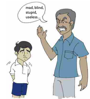
Teacher or parent verbally abusing a child

ਉਸ ਨੂੰ ਪਾਗਲ ਜਾਂ ਬੁੱਧੂ ਕਹਿ ਕੇ ਬੁਲਾਉਂਦਾ ਹੈ।